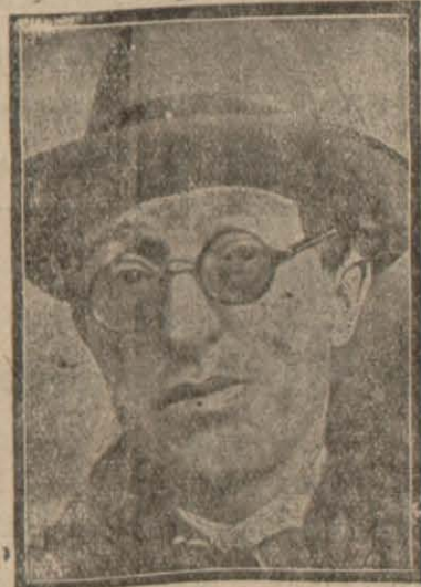
Hariciye Vekili Tevfik Rüştü B. ramında yapılacak olan merasimde de bulunacaklardır.

Dört hariciye nazırı burada içtima ederek paktın imzasından bu güne kadar geçen zaman zarfında elde edilen neticeyi tetkik edecekler ve yeni tedbirler alacaklardır ikinci içtimain Atina'da olması muhtemeldir. Hariciye nazırları cumhuriyet bay-